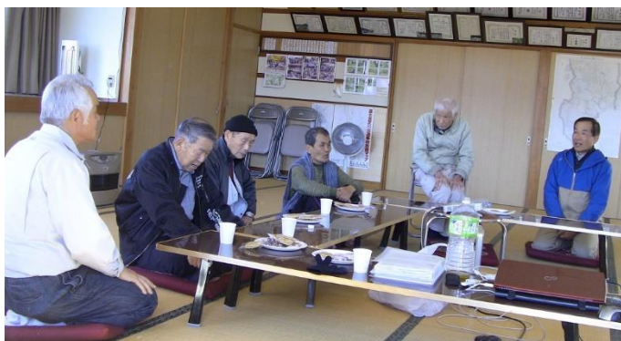
2/21 民生委員を交えて最近の話題を話し合う