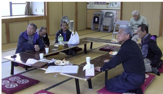
3/21 平成29年度の活動計画案を話し合う