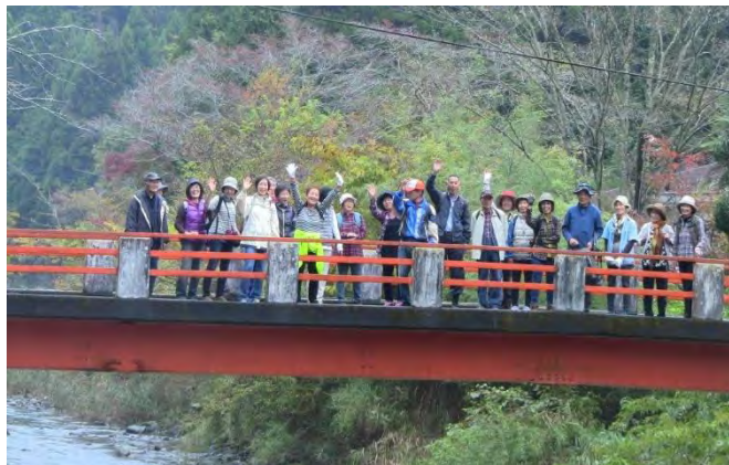
11/15 稲子側紅葉健康ウォーキング 橋の上で