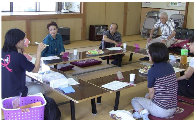
歯科衛生士との座談会を実施